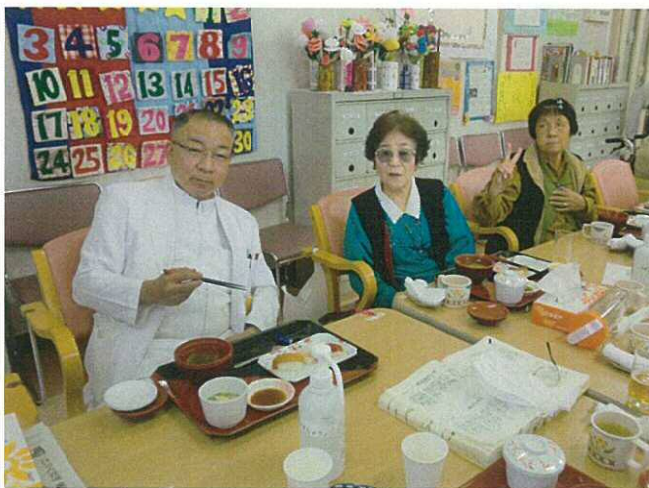
寿司レストランではご利用者と一緒に…

「施設は、ご利用者及びご利用者のご家族のためにある」この理念の元、本年は、「基本を大切に、今行っているケアがご利用者及びそのご家族の皆様のためになっているかを考え、ご利用者中心の施設になるよう」運営して参りたいと考えております。2年後、ぐらんぼぐらんまは創立20周年を迎えます。この節目に何としても在宅強化型老健として迎えたいと思っております。施設と在宅をいつでも行き来できる、そんな老健を目指して参ります。どうか、今後ともご指導ご鞭撻のほど何卒よろしくお願い申し上げます。